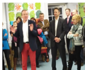
Réception en présence du Maire de Bristol (à gauche)