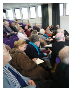
Assemblée Générale 2015