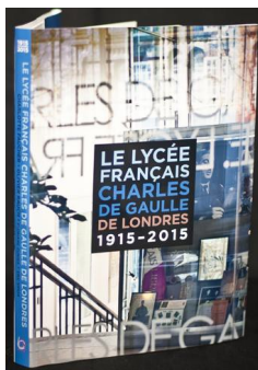
Couverture du livre paru