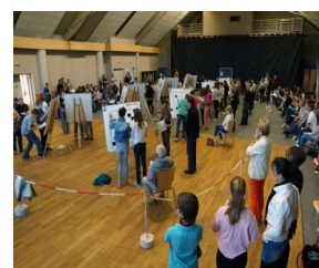
Le concours bat son plein!