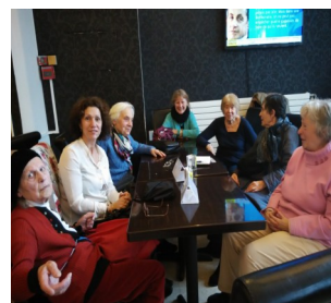
Réunion à l'Institut Français de Londres