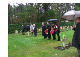
Au cimetière de Brookwood