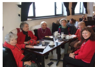
Café philo du 20 novembre