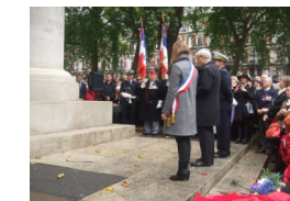
Devant la statue du Maréchal Foch à Londres

La cérémonie se prolongea au Cimetière américain de Brookwood (Surrey) - le plus grand cimetière du Royaume Uni - en commémoration des Forces françaises libres (Free French) de la 2e guerre mondiale.