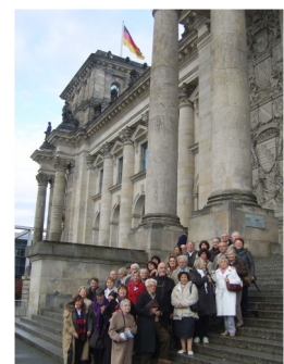
Sur les marches du Reichstag