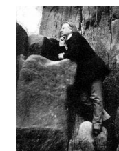
Victor Hugo en exil à Jersey (années 1850)

Cercles Français, il entend développer le côté culturel d'une Alliance qui aurait pu se contenter de l'enseignement de la langue. Il a aimablement répondu à ma demande et donne les précisions suivantes: