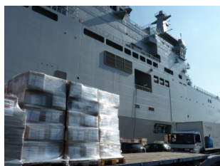
Livres prêts à être embarqués sur le Tonnerre