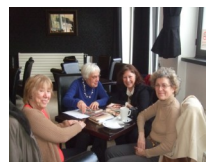
Café philo: réunions:

Vous êtes cordialement invités à vous joindre à nous autour d'un café à l'Institut Français de Londres pour notre prochaine réunion qui aura lieu mercredi 17 avril; 14.00 heures à l'Institut.